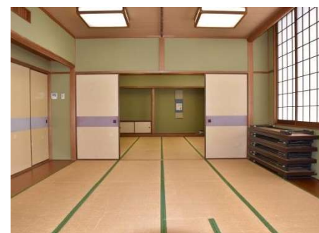
第1和室(奥)・第2和室(手前)／2階、各10人