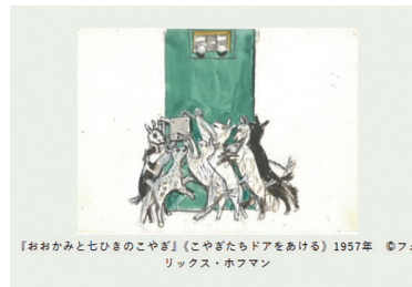
『おおかみと七ひきのこやぎ』《こやぎたちドアをあける》1957年 ©フェリックス・ホフマン