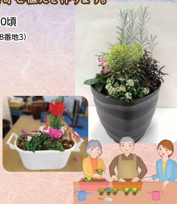
※写真はイメージです。植材等、実際のものとは異なります。