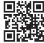
全福ネット防災シリーズ